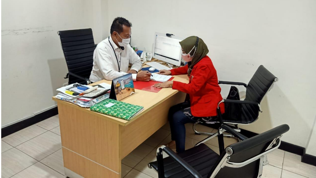
Wawancara dengan Deputy Service Manager P.T. Bank Tabungan Negara (Persero) Tbk. Kantor Cabang Banyuwangi.